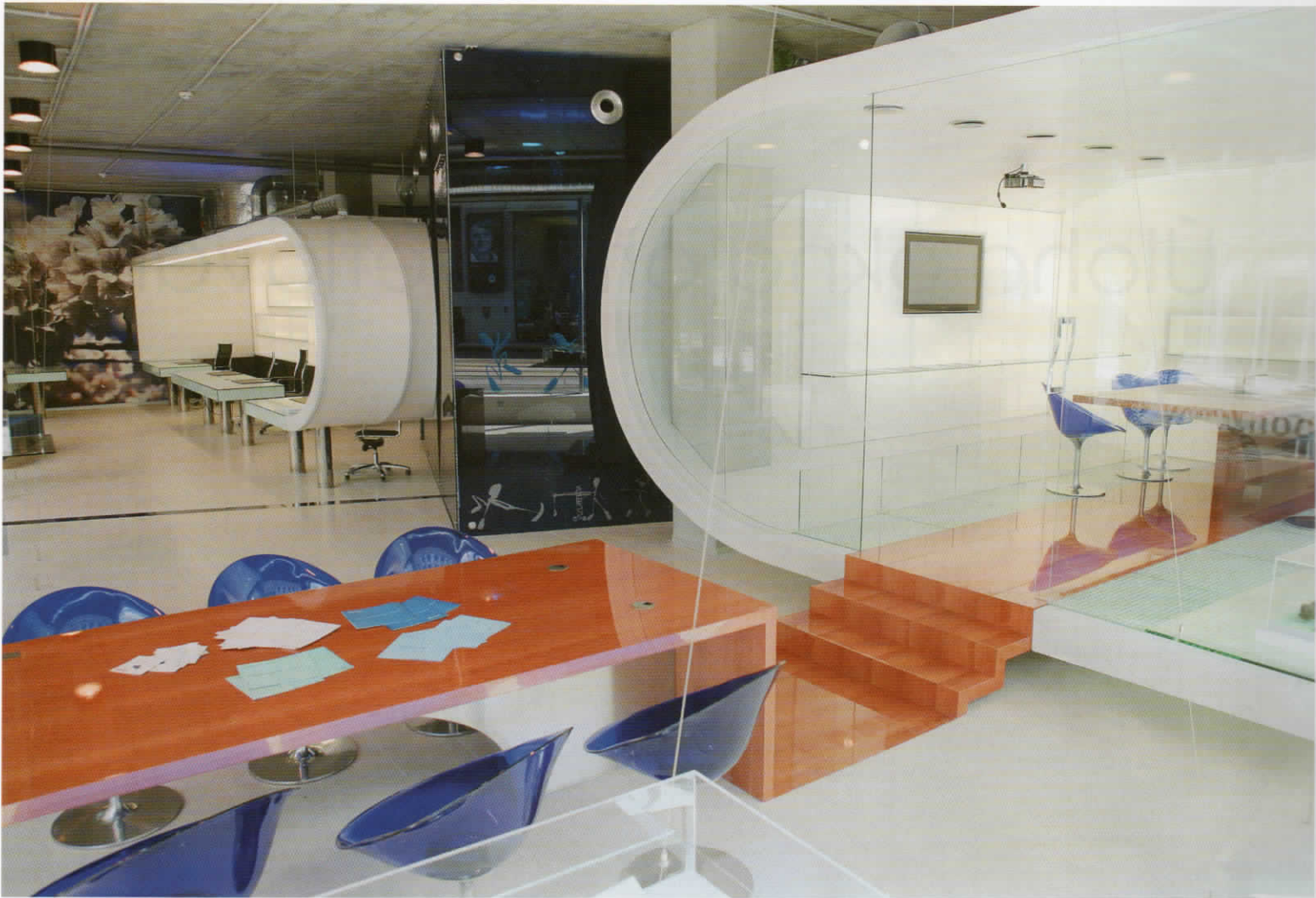
■ Celkový pohled na zákaznické centrum Hochtief CZ.